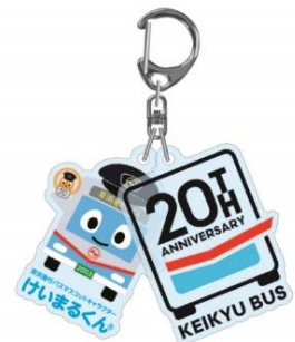
【2連アクリルキーホルダー】