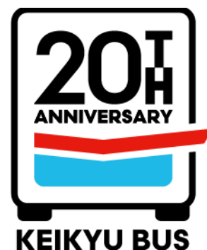
【20 周年記念ロゴマーク】