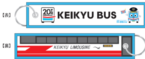
【フライトタグ型キーホルダー】