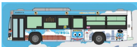
【バスコレクション（けいまるくんラッピングバス）】