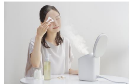
▲1回の使用で、水分量と浸透量約 20%UP ※8