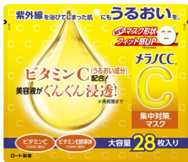
▲【ロート製薬】 メラノCC 集中対策マスク （大容量 28 枚入り）