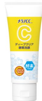
▲【ロート製薬】 メラノCC ディープクリア酵素洗顔