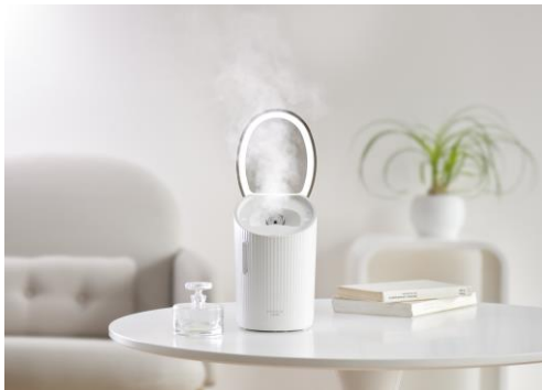
▲【アイリスオーヤマ】 フェイススチーマー