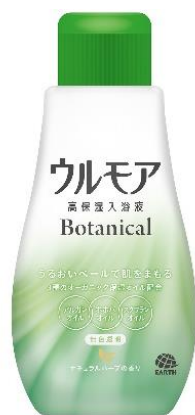
『ボタニカル ナチュラルハーブの香り』