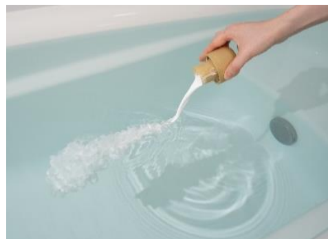
クリーミーフローラルやクリーミーローズ の使用イメージ

『ウルモア』シリーズは、“素肌の乾燥に着目した保湿入浴液”をコンセプトに 2010 年に発売しました。うるおい効果を感じられる入浴液としてご好評をいただいております。当社の入浴剤に関する調査において、顔以外の肌や体について気になる悩みについて調査した結果、「乾燥・かさつき」が約 46%と悩みの 1 位であることが分かりました ※1 。そこで当社は、配合する保湿成分を見直すとともに、パッケージを一新し、本商品をリニューアルしました。なお、パッケージデザインはお客様目線の評価結果を活用しています。