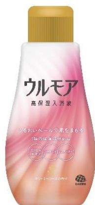
『クリーミーローズ の香り』