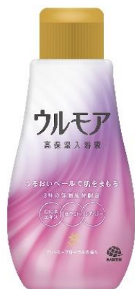
『クリーミーフローラル の香り』

アース製薬株式会社（本社：東京都千代田区、社長：川端克宜、以下「アース製薬」）は、ボディクリームを塗ったような保湿力がある入浴液『ウルモア 高保湿入浴液』『ウルモア 高保湿入浴液 ボタニカル』を全国でリニューアル発売しました。