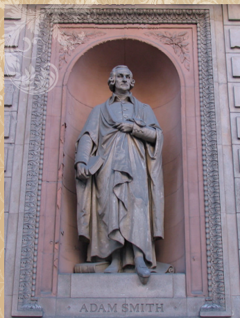
ロンドンのRoyal Academy of Artsの外壁に立つアダム・スミス像

ローダデルは、スミスの最初の体系的批判者とされ、経済学史上で特異な位置に立っている。東京経済大学はその主著『公富論』の原型とも言える膨大なコメントを付した『国富論』初版本を含むローダデル旧蔵の経済学文献コレクションを所蔵し、インターネット上で公開している。本講演では、同時開催の展示会に出品している貴重書の解説も兼ね、ローダデルを中心にスミスをめぐる経済学者たちの仕事について概説する。