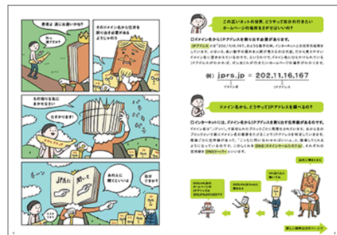
～マンガ小冊子 内容イメージ～

※小冊子は、参考 URL 『ポン太のネットの大冒険』より、PDF 形式でもダウンロード・閲覧が可能です。