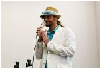
パラリンアート事務局 セイン理事