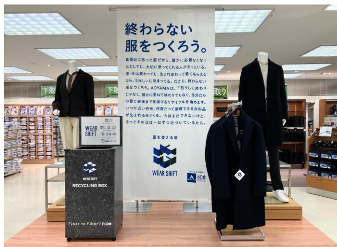
特別演出店舗イメージ（洋服の青山 池袋東口総本店）

青山商事株式会社（本社：広島県福山市／代表取締役社長：青山 理 おさむ ）は、2024年5月に創業60周年を迎えるにあたり、もっと気軽にお客様と一緒に取り組むエコ活動として、不要になった衣類を回収するリサイクリング BOX「ウェアシフト」を、10月2日（月）から全国の「洋服の青山」店内に設置します。