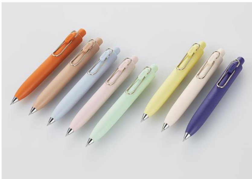
『uni-ball one P』