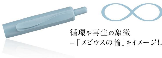
循環や再生の象徴 ＝「メビウスの輪」をイメージしたクリップ

マットな風合いが日常生活にもなじむ、ミニマルな軸デザインとなっています。また、「メビウスの輪」をイメージしたクリップ形状は、循環や再生を表現しております。