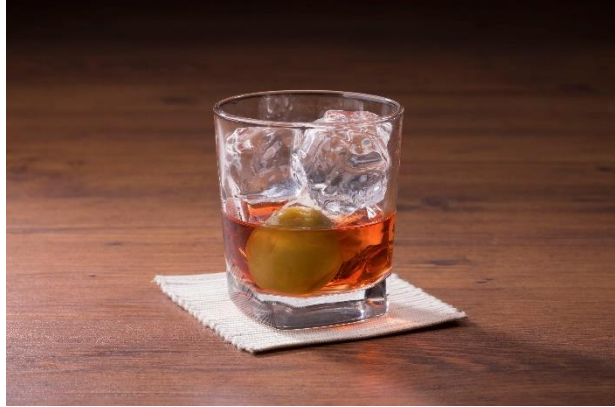
蝦夷蔵梅酒 富良野葡萄ロック 400円（税込440円）のところ、 200円（税込220円）