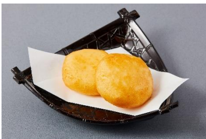
もちりチーズいも餅 390円（税込429円）