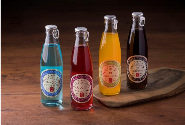
北海道ハイボール（全4種類） 各520円（税込572円）のところ、 260円（税込286円）