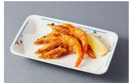
海老うまガーリック 490円（税込539円）