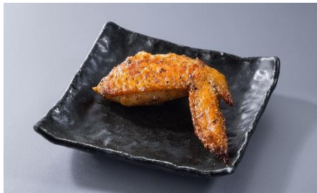
くせになる手羽先 1本180円（税込198円）