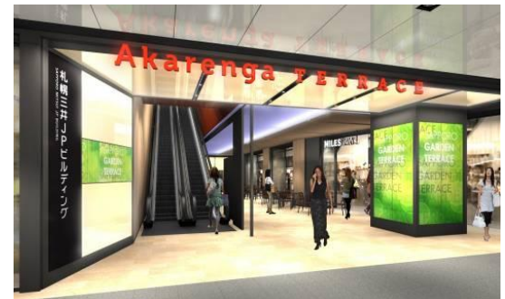
地下1階「エントランス」イメージ

本商業施設は平日1日約8万人が通行する札幌駅前地下歩行空間「チ・カ・ホ」からダイレクトアクセス可能な場所に位置しています。こうした立地特性を生かし、明るく開放的な環境を地下エントランスに整備します。光天井やデジタルサイネージなどを設置するほか、テーブルやイスなどを配したテラスを設け、憩いの空間を創出します。また、地下エントランスは、地上へのスムーズなアプローチとしてもご利用いただけるため、エリア全体の回遊性を高めます。