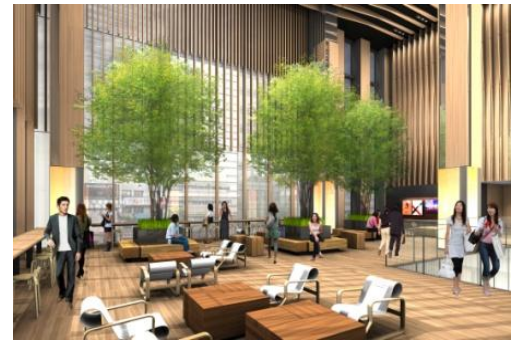
2階「アトリウムテラス」イメージ

商業内装デザイナーには「東京ミッドタウン」「三井アウトレットパーク札幌北広島」等の実績があるスタジオタクシミズの清水卓（シミズタク）氏を起用。このエリアの歴史や美しい風景にあった「煉瓦」や「木」といった自然素材を多く取り入れた自然感ある内装デザインとしました。居心地の良い都会のオアシスとして、夏は快適に、冬は暖かみを感じることもできる空間づくりとしています。