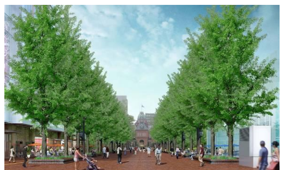
「札幌市北3条広場」完成イメージ