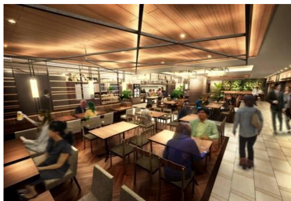
3 階「バルテラス」客席イメージ