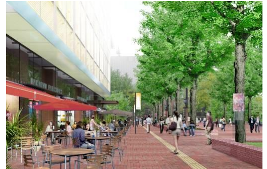
1階「オープンテラス」イメージ

札幌市北3条広場側に面した1階部分には、オープンカフェやオープンバルを配置し、広場と一体となった賑わいを創出します。季節の良い時期には、オープンテラスでイチョウ並木の木漏れ日と爽やかな風を感じながら、豊かな時間を過ごせる心地の良い空間を提供します。