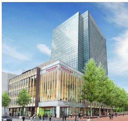
「赤れんが テラス (Akarenga TERRACE)」外観イメージ