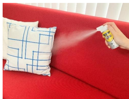
ダニが気になる布製のソファにスプレーしているイメージ