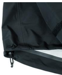
裾口アジャストコード