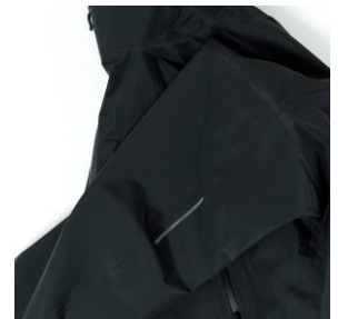
リフレクタープリント