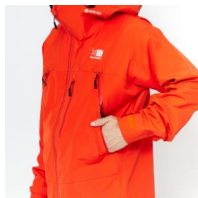
ウエストベンチレーションポケット