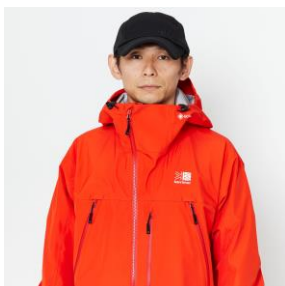
アシンメトリーフロントジッパー