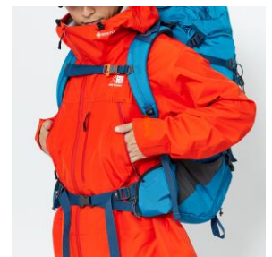
リュックサックに干渉しないポケット配置