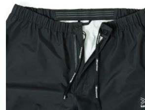
ウエストアジャストコード