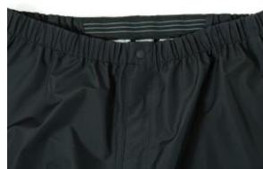
滑り止めウエストゴム