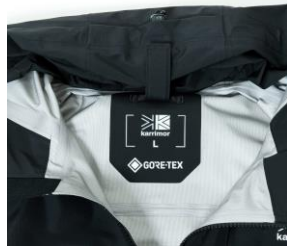
ロールアップフード収納