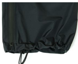
裾口アジャストコード