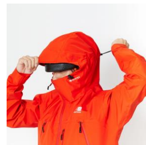
フードセパレートアジャスト仕様