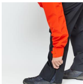
サイドオープンジッパー