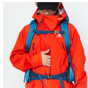
チェストポケット