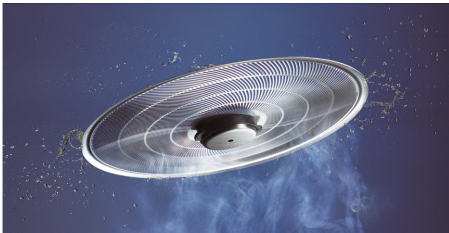
オイルスマッシャーの機構を支える高速回転ディスクのイメージ

※4 2014 年 6 月～2023 年 9 月末時点。国内・海外一般家庭用レンジフード、ARIAFINA ブランド国内一般家庭用レンジフード、国内業務用製品、ODM 生産品含む。