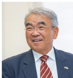
カーネギーメロン大学 教授 金出武雄