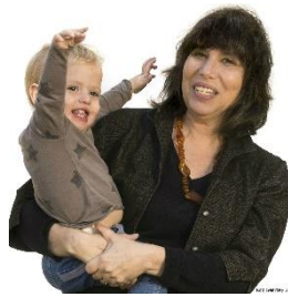
カリフォルニア大学 バークレー校 卓越教授 アリソン・ゴブニック