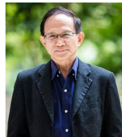
チュラロンコン大学 名誉教授 スリチャイ・ワンゲオ