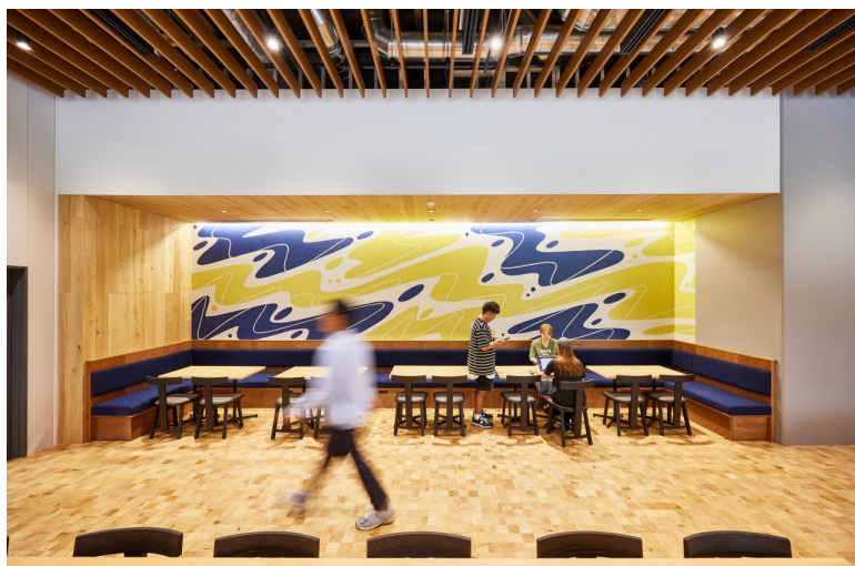
左) 縁起の良い松を、ZOZUSEDの破棄商材で彩った作品。右下はZOZOBASEつくば3の「3」をデフォルメ。 右) 筑波山(つくば3=つくばさん)のモンスターをイメージしたウォールアートがワーカーを見守ります。