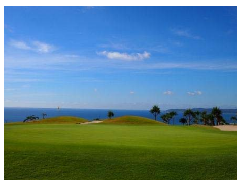
▲ 18番ホールより中城湾を望む