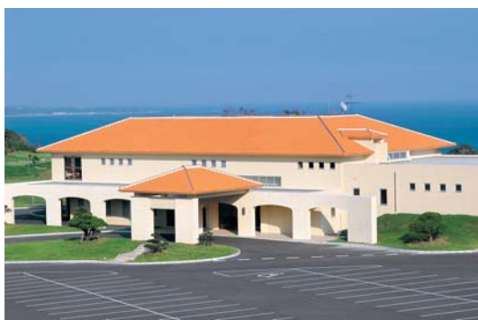
▲ アイボリーを基調とした南国風のクラブハウス

ゴルフ場は、那覇市内から車で約40分、沖縄本島中部の東海岸（太平洋側）に面した世界遺産「中城城跡」があることでも有名な中城村に位置しています。ほぼ全てのホールから海を見渡すことができ、大自然の地形を生かしながら池やバンカーを絶妙に配しており、女性やシニア、カジュアルプレーヤーから上級者まで、あらゆるゴルファーがご満喫いただけるコースです。また、アイボリーを基調とした南国風のクラブハウスは、エントランスやロッカールームに木目を使い、温もりと落ち着きのある雰囲気プレーヤーをお迎えします。