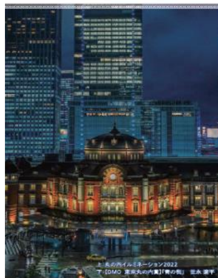
『CENTRAL TOKYO ILLUMINATION ガイド 2023』イメージ