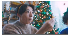
♪黒トリュフ風味の