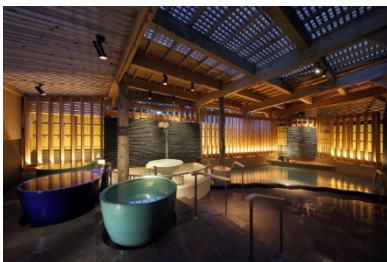
函館・湯の川温泉 ホテル万惣