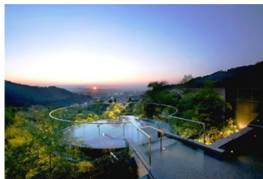
会津・東山温泉 御宿 東鳳