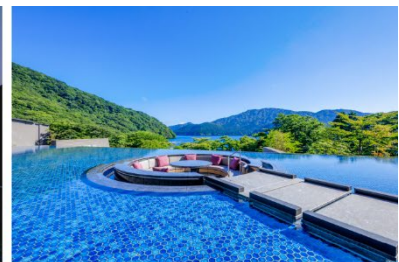
箱根・芦ノ湖 はなをり