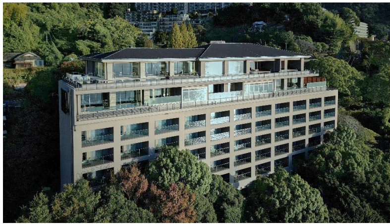
熱海・伊豆山 佳ら久 外観