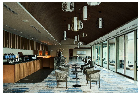
ゲストラウンジ「間 (AWAI)」

「刻」は多くの文化人に別荘地として親しまれた熱海の歴史を感じられる設えとしました。熱海の山々を感じるテラスで、思い思いにおくつろぎいただけます。