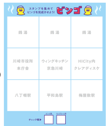
ビンゴ用紙イメージ