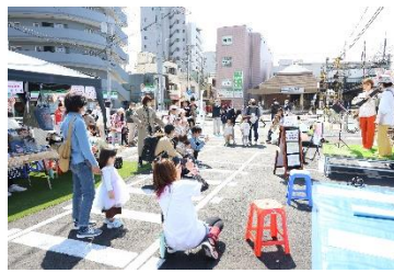
Park Line 870 でのイベント開催の様子