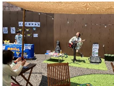
COCOON ひろば平和島でのイベント開催の様子