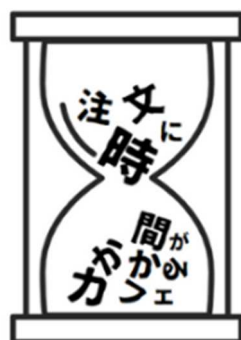
Chyumon ni Jikan ga Kakaru Kafe