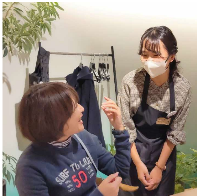
接客をするスタッフ