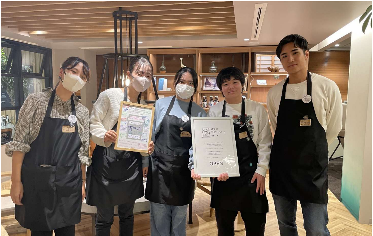
吃音当事者の学生スタッフ

大和ハウスグループの株式会社コスモイニシアは、当社が運営するシェアオフィス『MID POINT（ミッドポイント）』において、話し言葉が滑らかに出不い発話障害のひとつである吃音（きつおん）のある若者が接客にあたる、1日限定イベント「注文に時間がかかるカフェ」を実施いたしましたので、お知らせします。