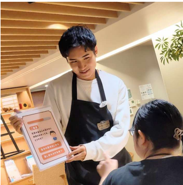
「吃音」に関するクイズを出題するスタッフ

イベントを開始すると、お客さまは学生スタッフからカフェのコンセプトや吃音についての説明を受け、その後はスタッフとのゆっくりとした会話を楽しまれていました。事前に用意した吃音にまつわるクイズを出題し、理解を深める場面もありました。クイズの最後には、「吃音の症状は人によってさまざまです。『あなたはどうか接してほしい？』と聞いて、その人に合った支援をしてあげてほしいです。」と締めくくりに、吃音当事者に対する個別性のある支援を呼びかけていました。