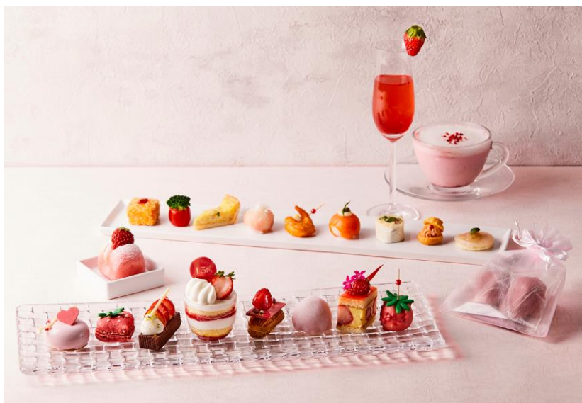
「ストロベリーコレクション」イメージ

ハイアットリージェンシー 東京(所在地:東京都新宿区西新宿 2-7-2、総支配人:角田直之)の「カフェ」では、時期を迎えるいちごをふんだんに使用した華やかなスイーツと、バリエーション豊かなセイボリーを楽しめる「ストロベリーコレクション」を、2024年1月15日(月)から3月31日(日)までの期間限定で提供します。