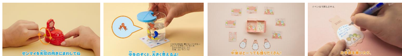
<おもちゃの遊び方紹介動画(一部)>

【マクドナルド公式ホームページ】 https://www.mcdonalds.co.jp/family/happysset/