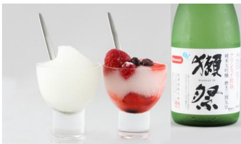
写真左:クリンスイ仕込 だっさい フローズン「スタンダード」 写真右:クリンスイ仕込 だっさい フローズン「フルーティー」

“さまざまなこだわりのお水を体感できるカフェ” ミズ カフェ 「MIZUcafé PRODUCED BY Cleansui」(東京都渋谷区神宮前6-34-14 原宿表参道ビル1F 以下、MIZUcafé ミズ カフェ )では、硬度ゼロの“超軟水”で仕込んだオリジナル日本酒「クリンスイ仕込 だっさい 純米大吟醸 磨き三割九分」をベースにした「クリンスイ仕込 だっさい フローズン」2種を夏の新メニューとして2014年7月1日(火)より提供開始します。