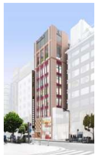
「新宿中村屋ビル」外観イメージ