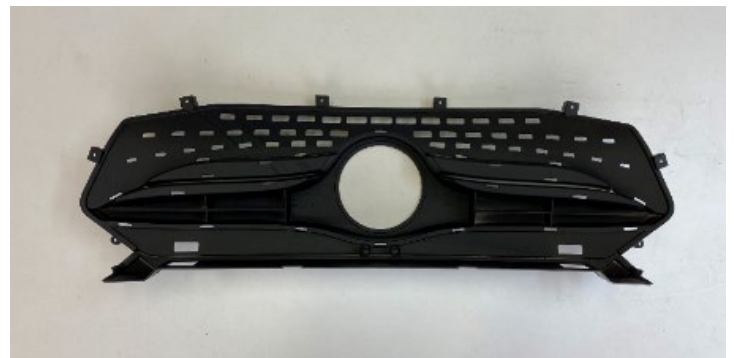
「サブスク 3D プリント」の樹脂造形物サンプル