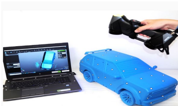
風洞実験ソリューションサービスのモックアップ (模型イメージ)