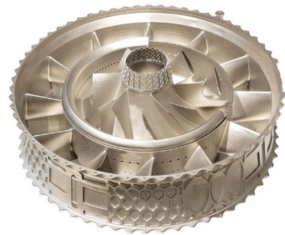
BLT 社製金属造形物サンプル