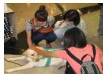
▲&EARTH 盲導犬ふれあいキャンペーン