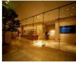
▲汐留ミュージアム