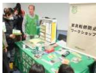
▲&EARTH 災害に負けない知識を学ぼう！