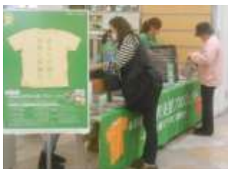
▲&EARTH 衣料支援プロジェクト

三井不動産グループの商業施設では、その一環として、不要になった衣料品を世界各国の難民や被災者の方へ送る「&EARTH 衣料支援プロジェクト」や、誰でも楽しく学べる震災対策「&EARTH 災害に負けない知識を学ぼう！」、盲導犬などの理解や知識を深めていただく「&EARTH 盲導犬ふれあいキャンペーン」など、幅広い年代の方が来場する商業施設という場所を活かし、様々な活動を行っています。