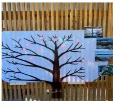
メッセージボード（イメージ）

プレゼント：ご記入いただいたお客さま先着 100 名さまに油壺温泉入浴剤 1 個をプレゼントいたします。（お一人さま 1 回 1 個）