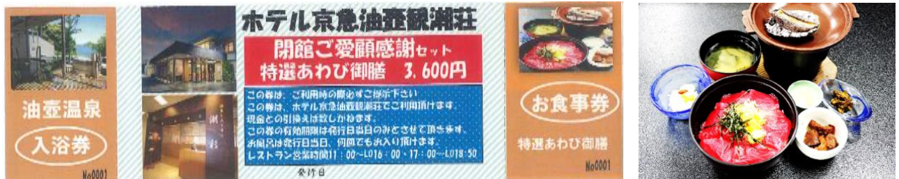
チケット（入浴＋お食事）