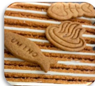
閉館限定デザイン缶クッキー（イメージ）