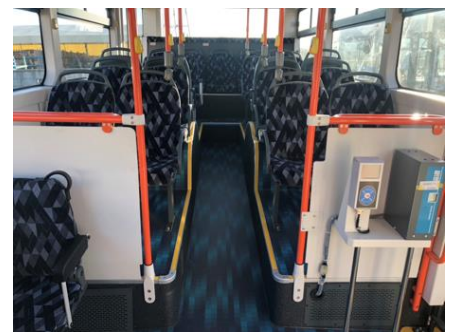
【フルフラットバス】

車内後方の段差をなくし、転倒防止につなげるとともに、後方まで移動しやすくなるため、前方での混雑が緩和され、より快適な通勤・通学が可能なバスとなります。