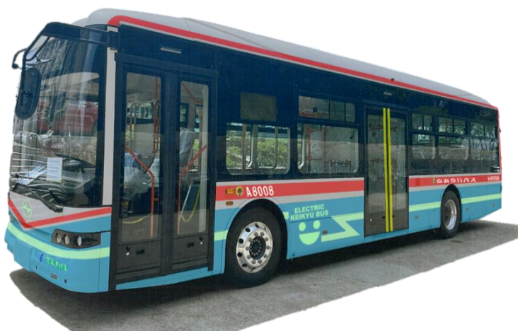
【バス外観イメージ】

京急バスでは、今後も京急グループが掲げる2050年カーボンニュートラルの達成、脱炭素社会の実現に向け環境に配慮したバスの導入を進めてまいります。詳細は別紙のとおりです。