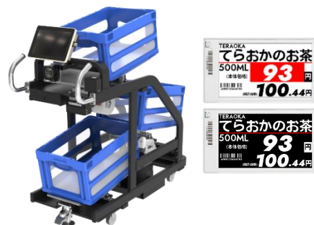
▲「3 マルチピッキングカート」 ▲電子棚札「InfoTag」

※1 寺岡精工調べ（インターネット調査）調査期間：2019/1/11～13 エリア：全国 調査対象：週1回以上スーパーマーケットで買い物をする20～60代の男女 515名