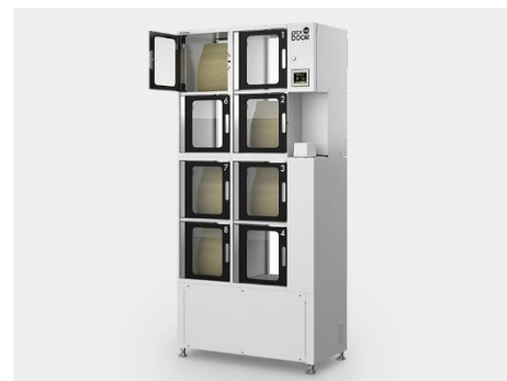
▲受け取り専用ロッカー「ピックアップドア」

お客様自身がお店で商品を選びながら専用のスマホアプリでバーコードをスキャンするスマホレジ