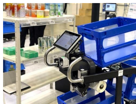
▲「3 マルチピッキングカート」でのピッキング作業イメージ

当社は今後もお客様のニーズに応えたお買い物体験を創造するとともに、流通小売業における人手不足解消や業務効率化に貢献するソリューションを提供してまいります。