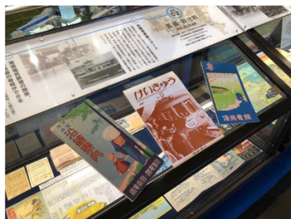
コレクションイメージ

※NFT Non-Fungible Token，非代替性トークンの略称で，「偽造・改ざん不能のデジタルデータ」であり，ブロックチェーン上で，デジタルデータに唯一性を付与して真贋性を担保する機能や，取引履歴を追跡できる機能をもつ。