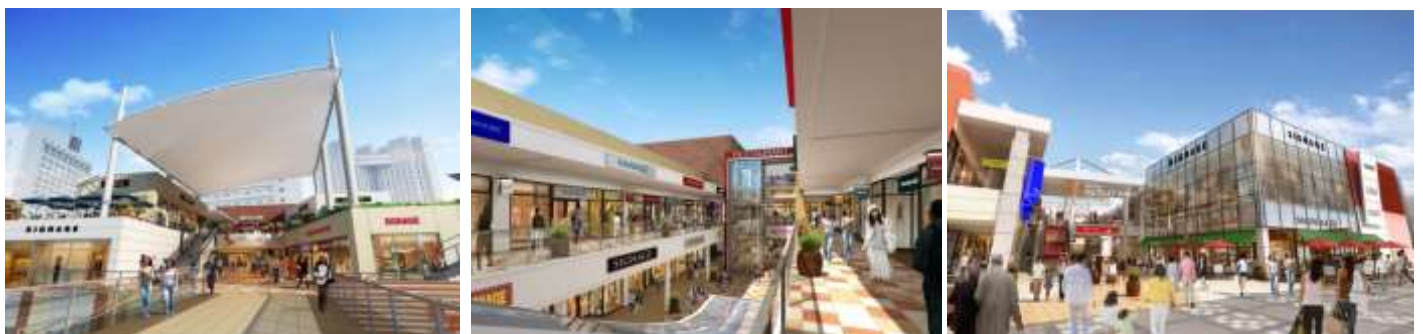
「三井アウトレットパーク 幕張」（イメージ）

左：第3期施設ブリッジ 中：第3期施設内観 右：第1期施設 海浜幕張駅側エントランス