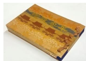
昭和 11 年(1936)版「平安紋鑑」

紋の形を細部まで正確に伝えたいという思いから発行された、家紋の集大成『 へいあんもんかん 平安紋鑑』の初版本を展示。また、一部ページのレプリカも作成しますので、めくってお楽しみください。