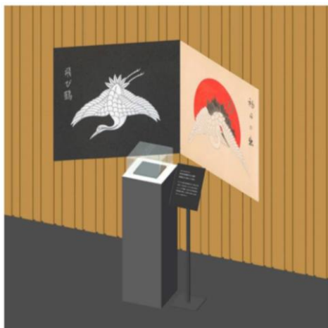
ギャラリー内部イメージ(仮)

長寿、富貴、繁栄などの願いが込められた家紋には、和菓子と共通するデザインが多く見られます。会場では家紋と虎屋に伝わる菓子見本帳の絵図を並べて配置し、実物の和菓子も一部展示します。また、壁面には、干し網や香辛料のクローブなど、ユニークなデザインの家紋のパネルを設置。吉野檜の組子壁を背景に、ずらりと並ぶさまは壮観です。