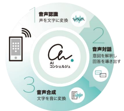
『AI コンシェルジュ®』サービスイメージ

『AI コンシェルジュ®』詳細はこちら： https://www.tactinc.jp/ai