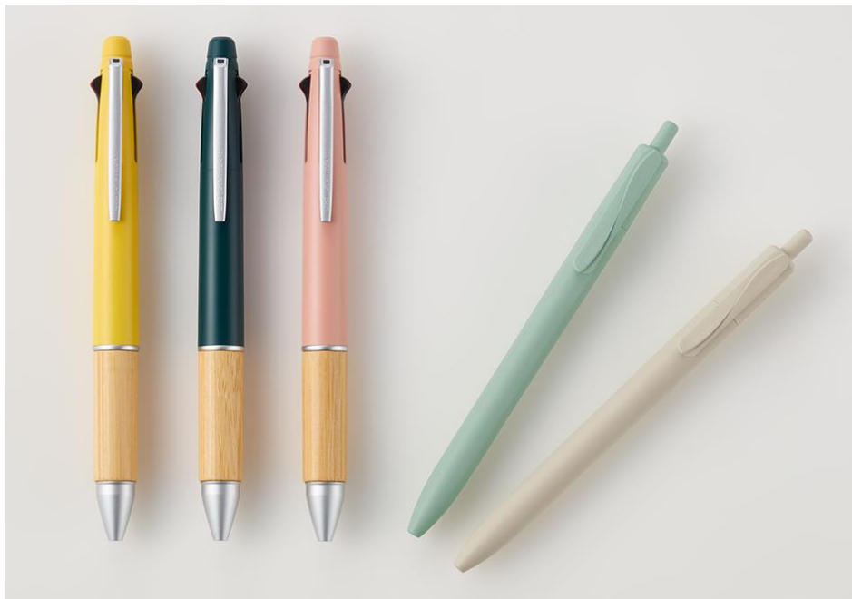
左から『ジェットストリーム 4&1 BAMBOO』ミモザイエロー、オレガノグリーン、ガーベラピンク 『ジェットストリーム 海洋プラスチック』ミストグリーン、サンドベージュ

『ジェットストリーム 海洋プラスチック』は、文具業界で初めてエコマーク商品類型 No.164「海洋プラスチックごみを再生利用した製品」の認定を取得(*)した、環境に配慮したボールペンです。日常生活にもなじむミニマルなデザインで、手に取った方が環境配慮に関心を持つきっかけになってほしいという思いも込められております。 *認定取得はライトブルーのみ