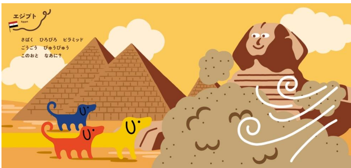
エジプトでは、スフィンクスとの出会いも。