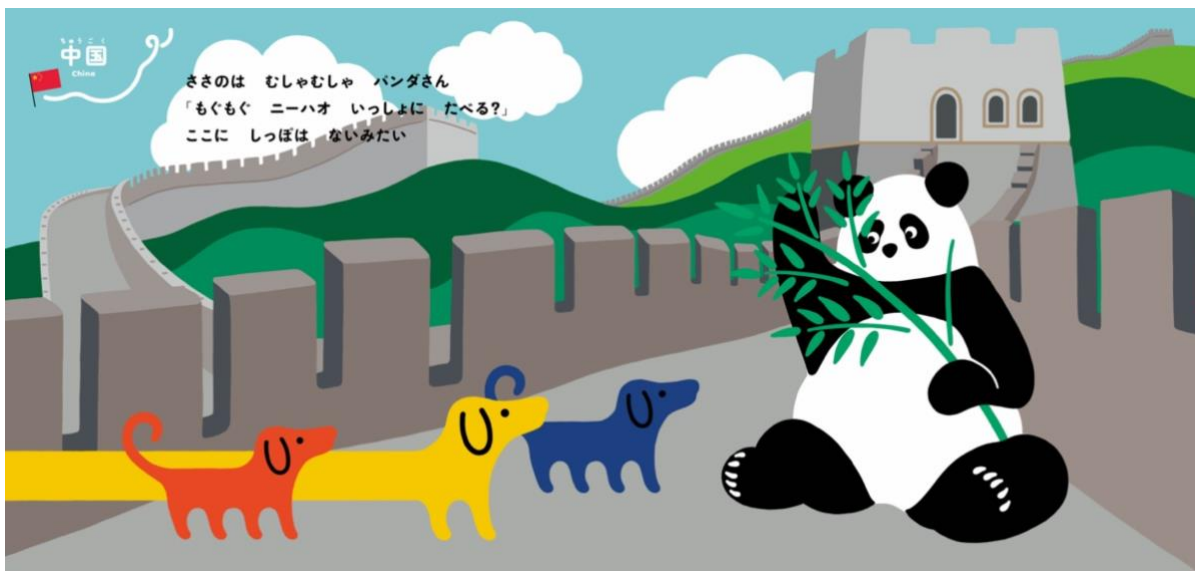
中国で、パンダにしっぽの行方を尋ねるシーン