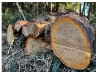
<間伐した社有林材>