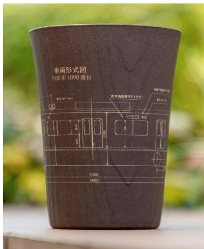
<車両形式図デザイン>