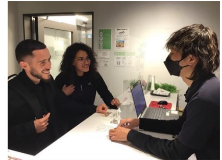
ホステル受付 イメージ

U R L https://plat-hostel-keikyu.com/hostel/minowa-forest/