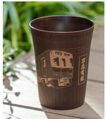
<浮世絵風デザイン>