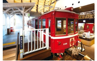
京急ミュージアム イメージ