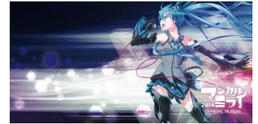
マジカルミライクエスト キービジュアル