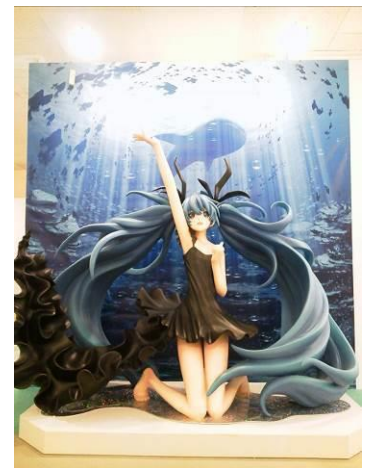
等身大フィギュア「深海少女」