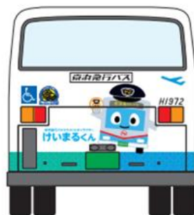
【羽田営業所 旧デザイン (2023 年 9 月運行終了)】