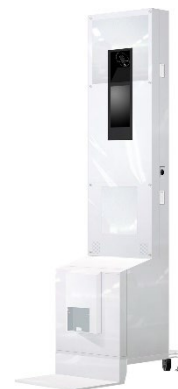
オリジナルプリントシール機 （イメージ）