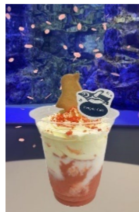
ハッピースプリングシェイク （イメージ）