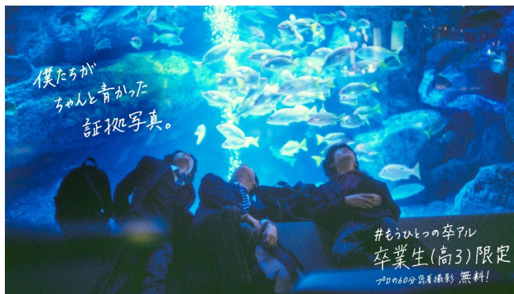
「#もうひとつの卒アル」 キービジュアル

すみだ水族館（所在地：東京都墨田区、館長：毛塚 広治）は、2024年3月8日（金）～3月31日（日）の期間、卒業など人生の節目を迎える皆さまを対象に、特別な思い出作りをお手伝いする「思い出増量プロジェクト」を開催します。さらにイベント期間中の最後の2日間は特別企画として「#もうひとつの卒アル」を実施します。