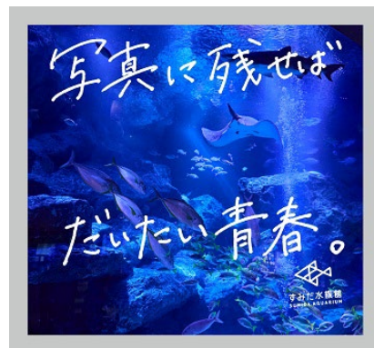
特設フォトスポット（イメージ）