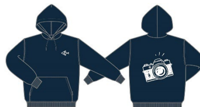
スタッフ 着用ユニフォーム（イメージ）

館内を回遊しながらお客さまをインスタントカメラで撮影するスタッフが登場します。撮影した写真はその場で 1 枚プレゼントします。撮影スタッフには、千葉大学写真部の皆さんも参加。インスタントカメラならではの趣のある、とっておきの 1 枚を受け取ってください。