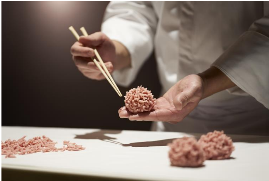
(カウンター席でのご提供イメージ)

2024年4月11日(木)にリニューアルオープンいたします「TORAYA GINZA」は、「最良の素材を選び抜き、職人の技術によってその個性を十分に生かした“最高に美味しい菓子”をつくり、素材や菓子のストーリーをのせてご提供したい」という思いを、喫茶を中心とした店舗で表現し、お客様をお迎えいたします。