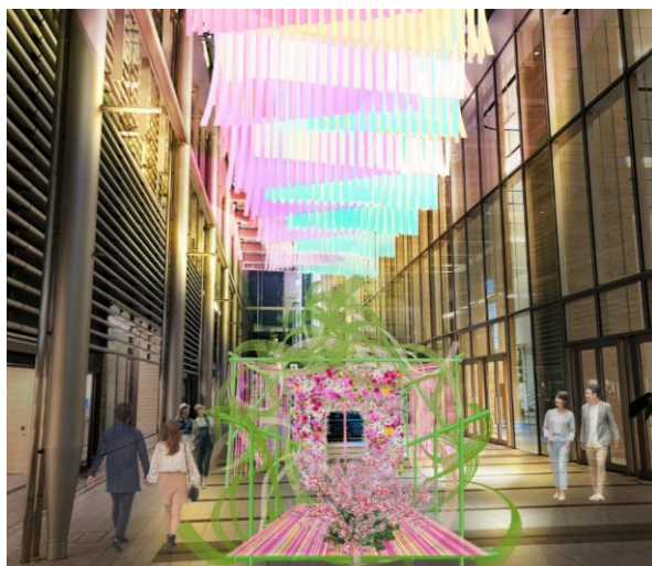
Moment of Bloomパース (イメージ)

東京ミッドタウン八重洲の玄関口ギャラリーには、施設コンセプト「ジャパン・プレゼンテーション・フィールド～日本の夢が集う街。世界の夢に育つ街～」を体現する巨大なフラワーアートが登場。日本古来から生活に根付き、日本文化を育んだ「竹」を職人の手仕事でアートに昇華。古代ヨーロッパで生まれ世界で親しまれる「リボン」と、約7,000輪の花を融合させ、“未来へのギフト”をイメージしたプレゼントボックスのようなフラワーアートで、皆様をお出迎えします。繊細さと力強さを兼ね備えた今までにないフラワーアート「Moment of Bloom」を東京ミッドタウン八重洲でご体感ください。