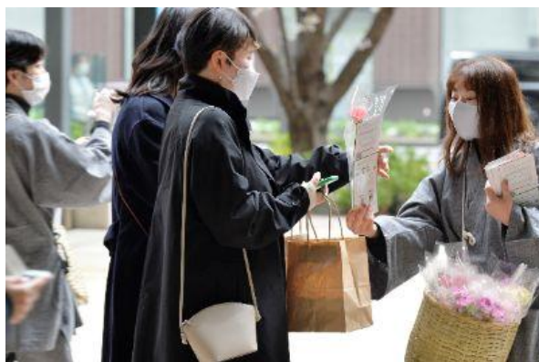
花の無料配布 (イメージ)