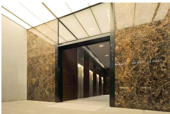
<オフィスエントランス>