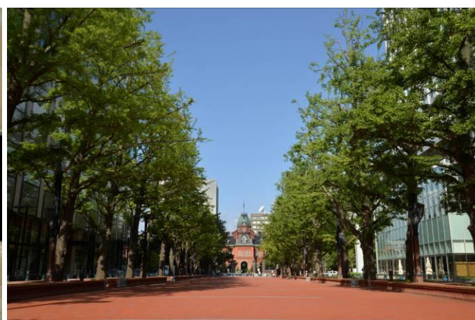
<札幌市北 3 条広場 (愛称 : アカプラ) >