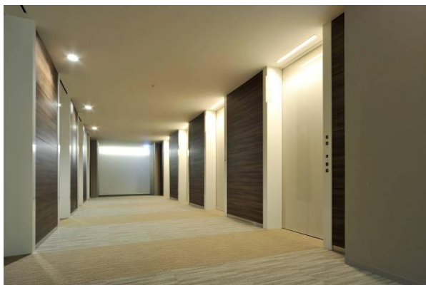
<基準階エレベーターホール>