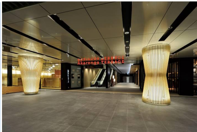
<札幌駅前通地下歩行空間接続部>