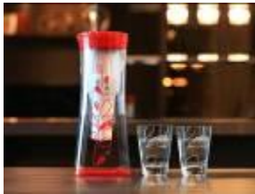
《クリンスイ30周年限定 バカラタンブラーセット》