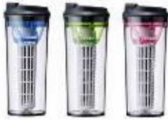
《クリンスイタンブラーTM804》

カフェ店舗内のインスタアベーカーリーの特設スペースでは、携帯型浄水器《クリンスイ タンブラー TM804》や、ポット型浄水器《クリンスイ CP025》、各製品用の交換カートリッジに加え、オリジナル製品《クリンスイ30周年限定 バカラタンブラーセット》、《MIZU グラス》、《ポータブルボトル》の製品を販売します。