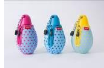
《ポータブルボトル》