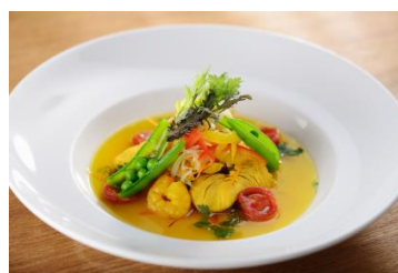
エリカ・アンギャルさん×Royal Garden Cafe監修 「低温で蒸し上げた鶏肉と海老、野菜のサフラン風味」 ※¥1,300(税込)にて提供 (平日ランチタイムのみ、サラダ・スープ・ドリンク付き)