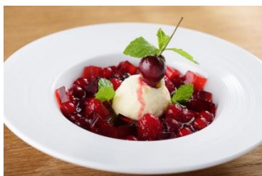
板井麻衣子さん×Royal Garden Cafe監修 「タピオカとミックスベリーのスープ仕立て ざくろシロップのゼリーと塩ミルクアイス添え」 ※¥680(税込)にて提供

8月7日(木)に実施するトークイベントのゲストである元ミス・ユニバース・ジャパン公式栄養コンサルタントのエリカ・アンギャルさん、ナビゲーターで2010年ミス・ユニバース・ジャパンの板井麻衣子さんと、Royal Garden Cafeのコラボレーションによるスペシャルメニューを提供します。