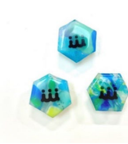
プロジェクトバッジ イメージ