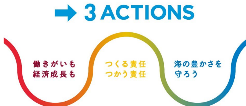
つなぐはぐくむツーリズムプロジェクト 三つの重点目標イメージ

「つなぐはぐくむツーリズム」では、SDGs の中で観光が主要テーマとされている、目標 8「働きがいも経済成長も」・目標 12「つくる責任つかう責任」・目標 14「海の豊かさを守ろう」の三つを重点目標に設定し、この目標の達成につながるアクションに触れる機会を提供します。