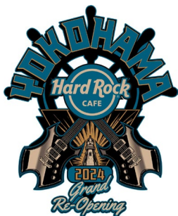
Re-Opening Pin 2,420 円