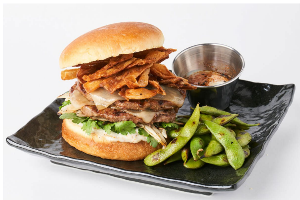
すき焼きダブルチーズバーガー 2,980 円 (税込)

七味マヨネーズを塗ったバンズに、薄く焼き上げたパティ 2 枚に特製 SUKIYAKI ソース、モンレージャックチーズ、ゴボウチップ、フレッシュ春菊、ネギのグリルをトッピングした牛鍋(すき焼き) 発祥、横浜にちなんだローカルバーガーです。お好みで半熟卵をかけてお召し上がりください。焼き枝豆付き。