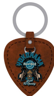
Re-Opening key Chain 2,640 円