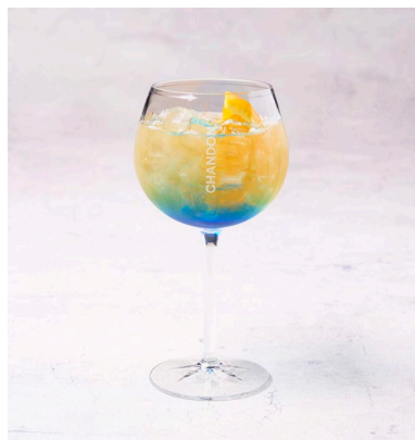
ブルーガーデン 1,500 円 (税込)

七味マヨネーズを塗ったバンズに、薄く焼き上げたパティ 2 枚に特製 SUKIYAKI ソース、モンレージャックチーズ、ゴボウチップ、フレッシュ春菊、ネギのグリルをトッピングした牛鍋(すき焼き) 発祥、横浜にちなんだローカルバーガーです。お好みで半熟卵をかけてお召し上がりください。焼き枝豆付き。