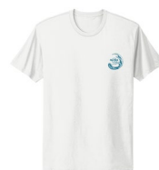
Re-Opening Tee Navy/White (サイズ S~XXL) 各 4,950 円