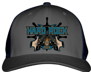
Re-Opening Cap 3,520 円