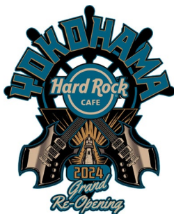
Re-Opening Magnet 2,860 円