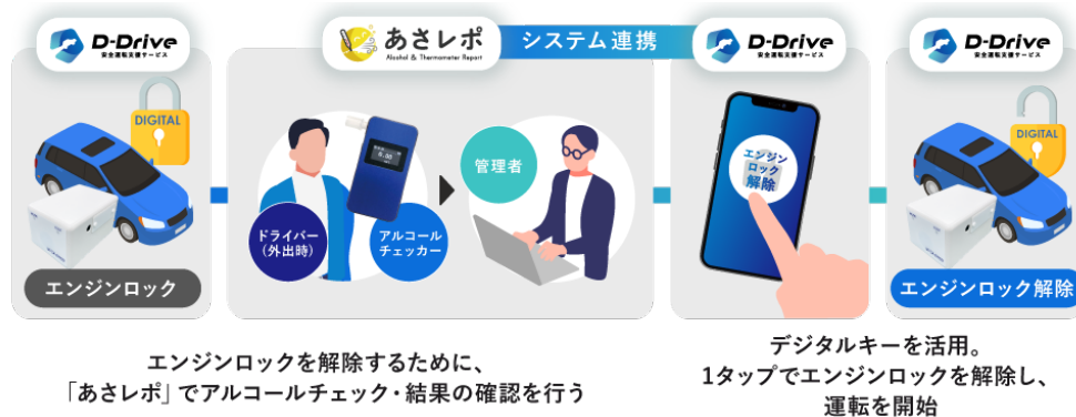
図: 「あさレポ」と「D-Drive」の連携イメージ

ドライバーが「あさレポ」でアルコールチェックを行い、管理者が乗車許可を行うと、システム連携により「D-Drive」アプリからエンジンロックを解除するためのデジタルキーをダウンロードできます。本サービスは、パートナー企業としてオリックス自動車株式会社（本社：東京都港区、社長：上谷内 祐二）が営業取次と車載機の取付け管理を行い、日本全国への提供体制を強化しつつ普及拡大を目指します。