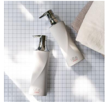
「ReFa BEAUTEACH SHAMPOO & TREATMENT」

温めながら、つまみ流す。肌に触れた瞬間に、温か さが広がる。心地よさに包まれながら2つのローラ ーでつまみ流せば、すべてから解き放たれます。