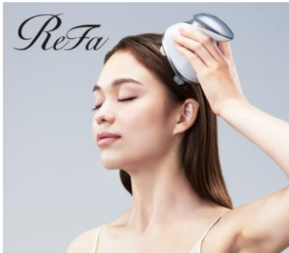
「ReFa BEAUTECH HEAD SPA」

より深く、もっと心地よく。 進化した頭皮リフトで、本格ヘッドスパ体験を。 エステティシャンの手技を心地よく再現する 独自テクノロジーをご体感ください。