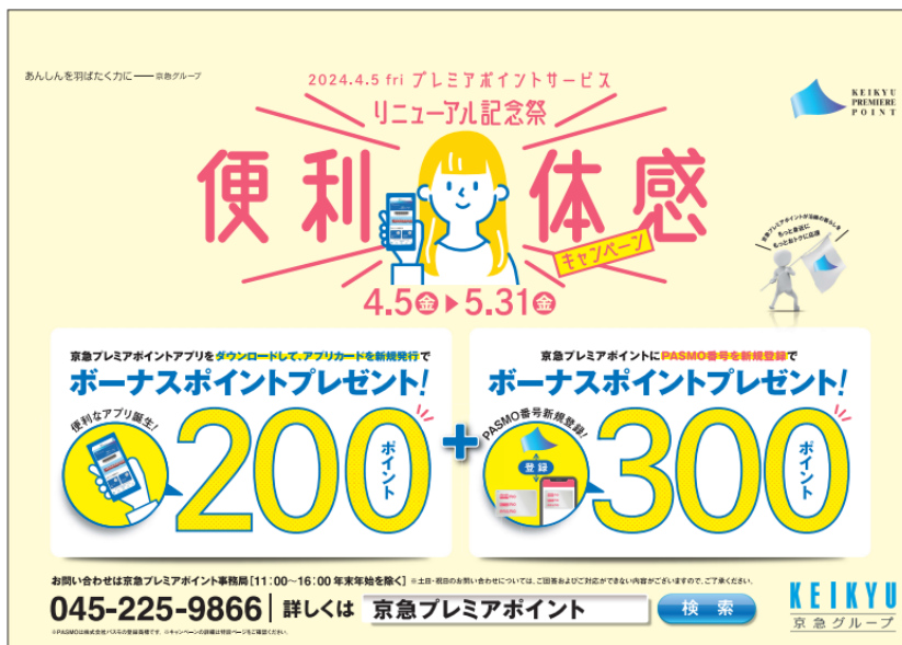
ポスターイメージ画像