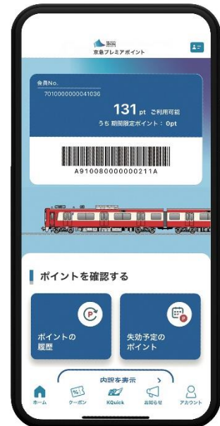
アプリイメージ画像